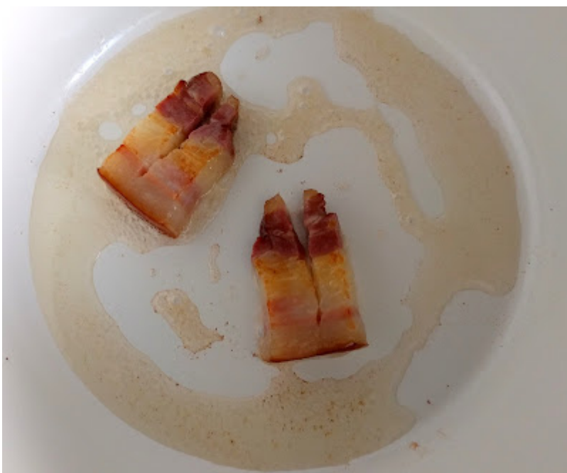
In einem Topf den Speck auslassen...