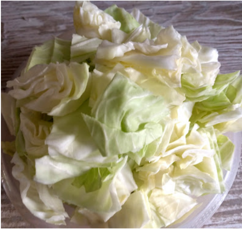
...und Kraut in grobe Stücke schneiden.