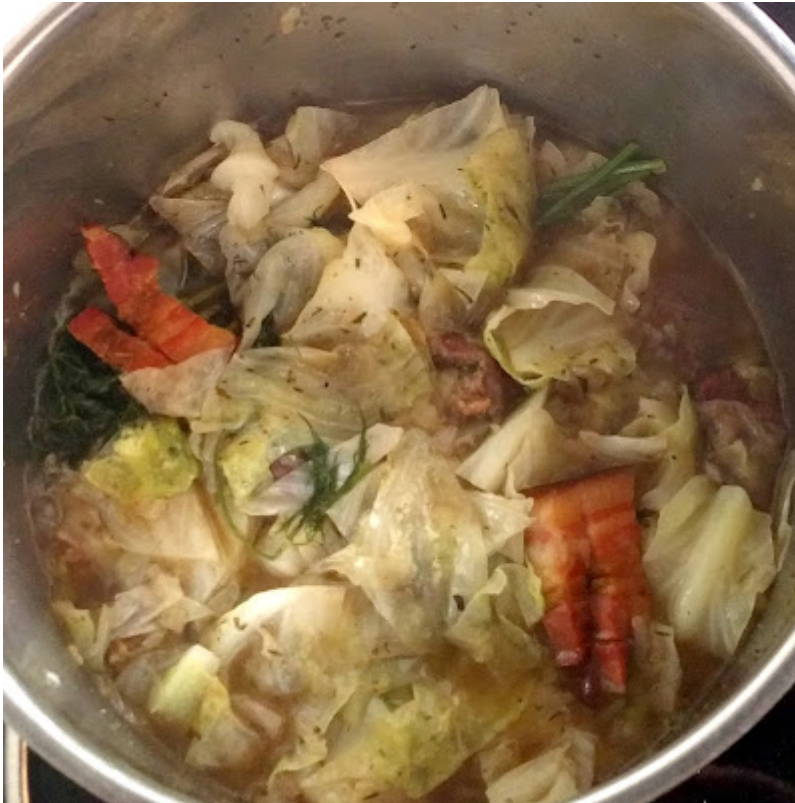
Das fertige Kraut...