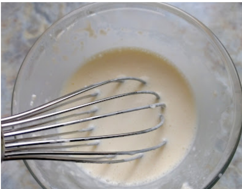
gebunden und noch kurz aufgekocht. ...wird mit etwas Mehl und Sahne