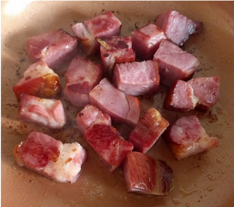
Den gerauchten Schweinehals in einer Pfanne leicht anbraten...