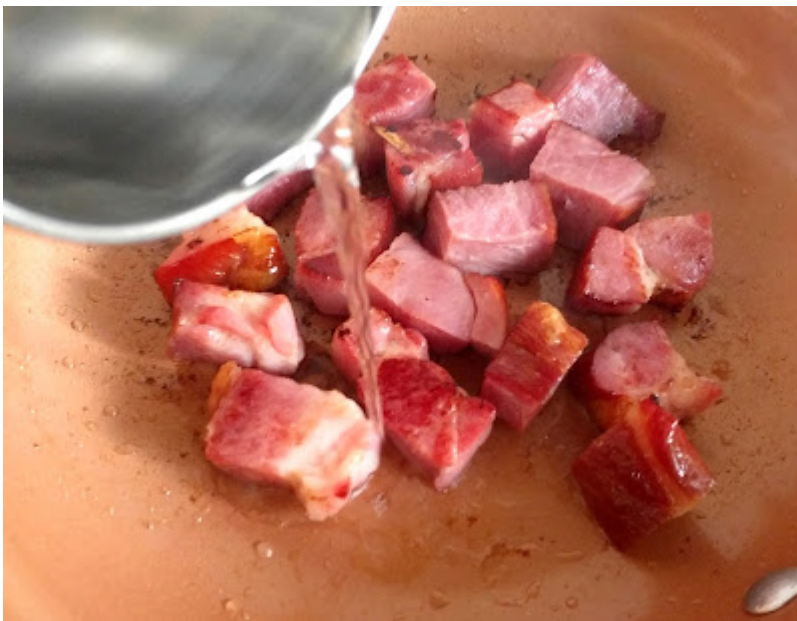
...ca 200 ml Wasser angießen und zugedeckt 5 Min köcheln.