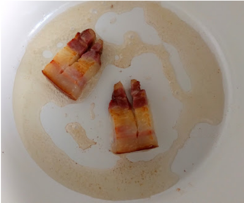
In einem Topf den Speck auslassen...