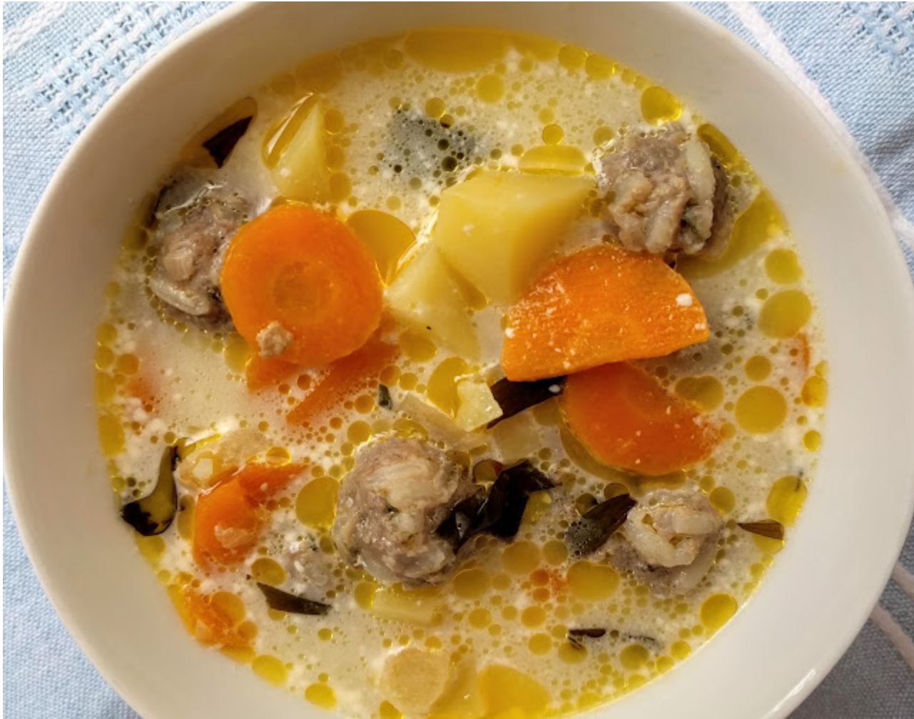
Sellerie, Karotten und Petersilienwurzel in Scheiben, Zwiebel in feine Würfel...