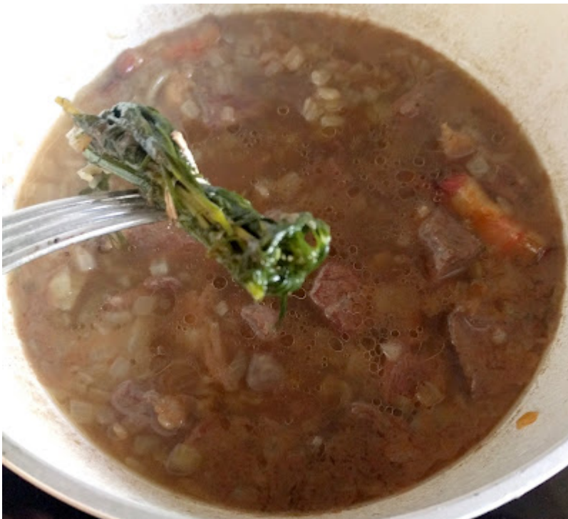
Aus dem gekochten Rindfleisch das Kräuterbündel entfernen...