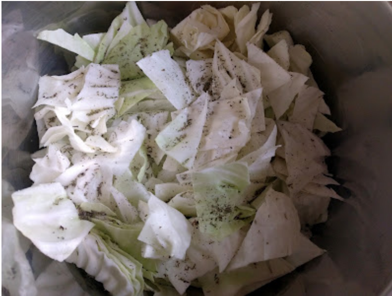
Die nächste Schicht Kraut, auch mit Bohnenkraut, Salz und Pfeffer würzen.